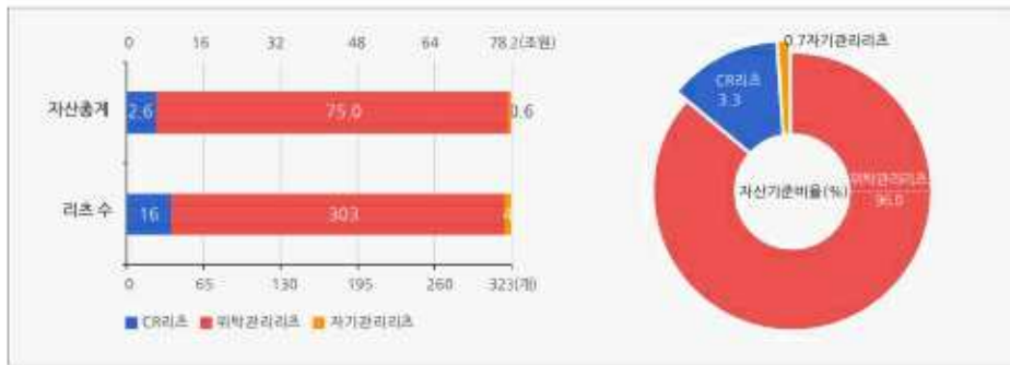
운용부동산 유형별 리츠 수 및 자산총계

* 기준일 현재 '22년 부동산투자회사법상 공모한 리츠 : 4개 기준일 현재 부동산투자회사법상 공모 예정인 리츠 : 14개